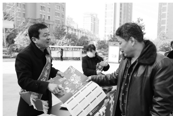
2月19日,泗洪县司法局组织公证员与普法志愿者走进青阳街道北新集居委会富园景都小区,开展 公证宣传日 暨 农民工学法活动周 现场活动。他们向市民发放宪法、民法典及公证法宣传资料和法治日历。

纠纷调处 解民心。开展 冬季农民工讨薪专项行动,组织欠薪投诉集中调处,对群体性欠薪事件实行挂牌督办,为务工者解决实际问题。加大协商解决的力度,对农民工讨薪案件进行和解调处,争取在最短时间、用最便捷方式解决欠薪纠纷。