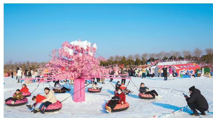
连云港市月牙岛开辟1.5万平方米区域进行人工造雪，建成冰雪乐园，让市民们在家门口畅享冰雪盛宴。图为近日市民在月牙岛体验冰雪项目。

信和物业安保团队实行24小时不间断巡逻，对出入口严格把控，有效防范各类安全隐患，并加强日常巡查，定期排查，制定了完善的应急预案，保障基础设施运行正常，确保能够迅速响应各类突发事件。信和物业绿化保洁团队精心打理社区环境，通过悬挂装饰、布置绿化等方式，对小区主出入口、主干道等位置进行美化，营造出温馨宜居的居住氛围，同时坚持日常保洁，确保环境卫生整洁，垃圾及时清运，为业主提供宜居、舒适的生活环境。下一步，信和物业将继续竭诚为广大业主提供更优质的物业服务，确保业主们享受到安全温馨的幸福生活。