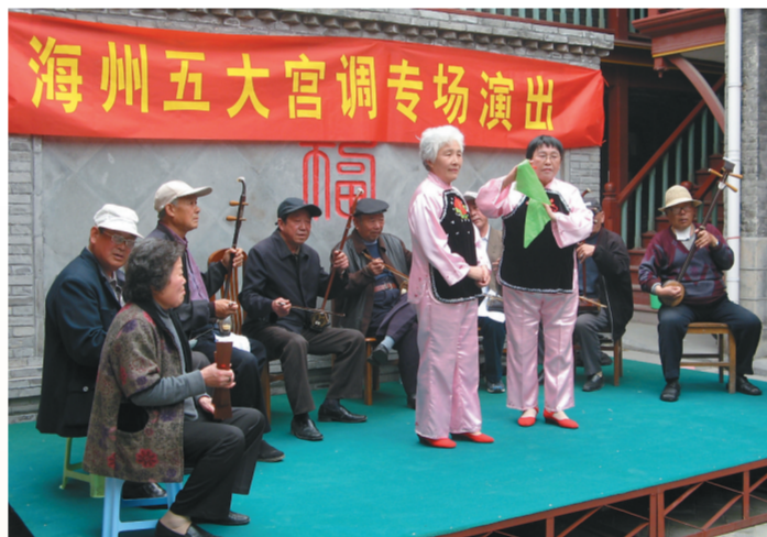
连云港市民俗博物馆内海州五大宫调专场演出

笔者近日走进位于连云港市海州区新浦路35号的连云港市民俗博物馆，近距离感受老港城的民俗文化魅力。该馆已形成具有地方特色的民俗藏品体系，反映了明清至今海州地区民俗文化概貌。