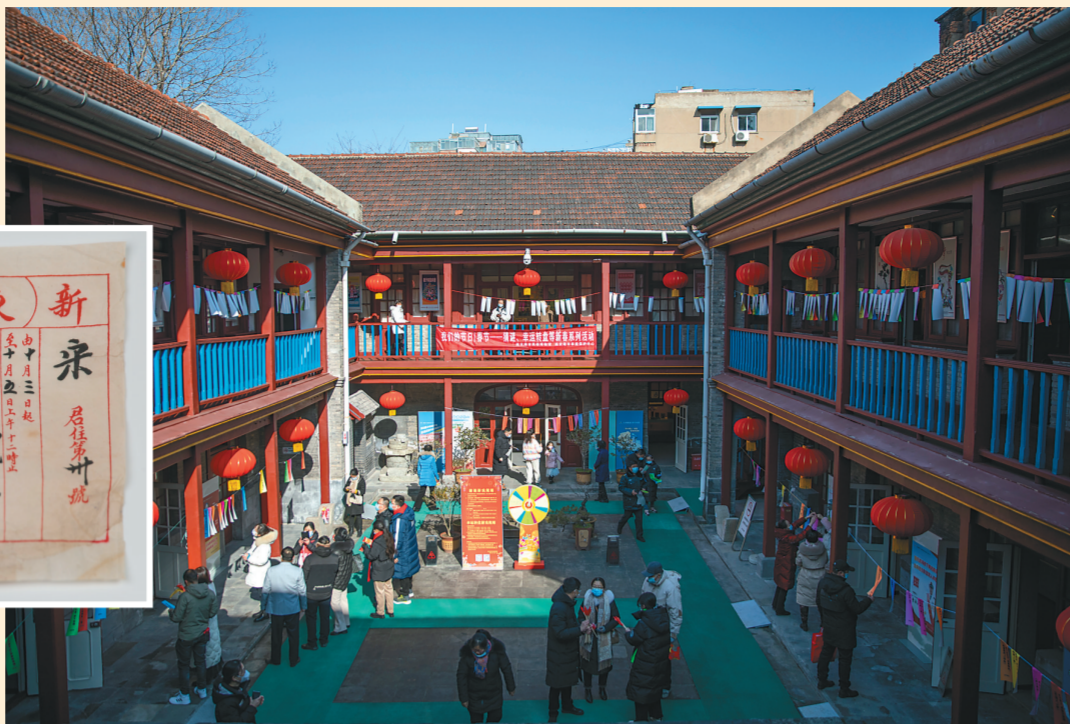
连云港市民俗博物馆举办春节系列活动