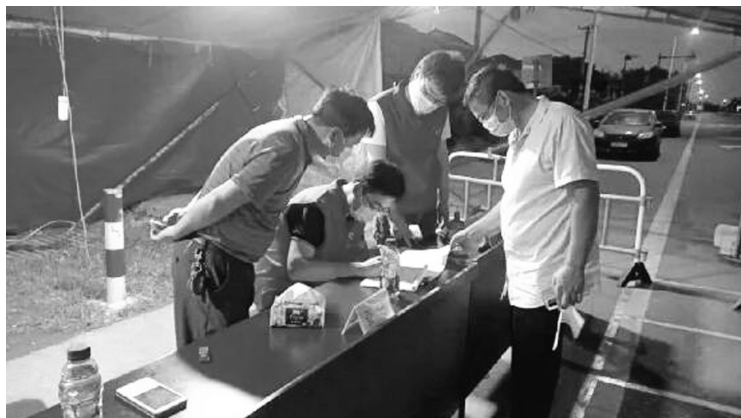
党员志愿者挑灯夜战