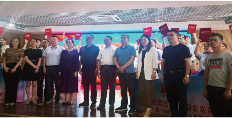
公司参与组织南通市崇川区安全生产知识竞赛