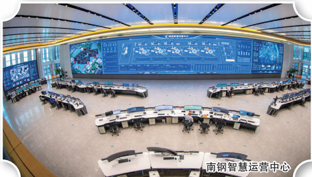
南钢智慧运营中心