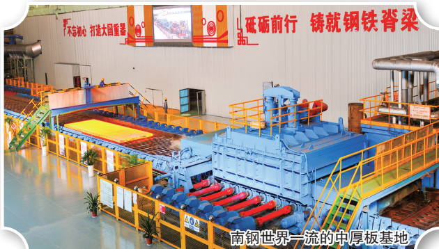
南钢世界一流的中厚板基地