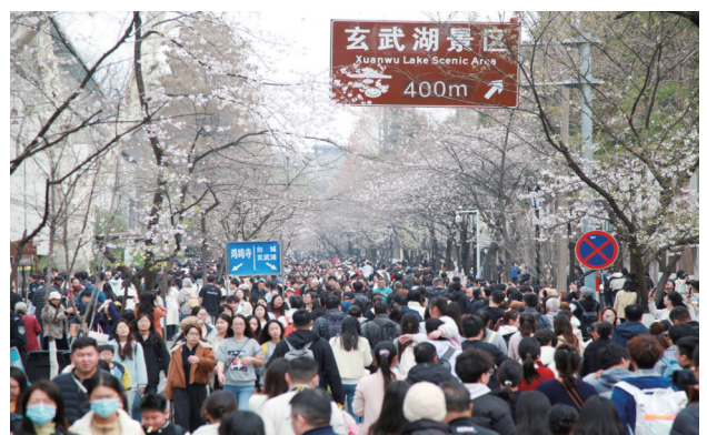
3月22日，南京鸣鸣寺路樱花开始绽放，吸引游人赏花游玩。

据悉，目前国内航线燃油费仍执行现行标准，即800公里以上航线燃油费为10元，800公里以下航线为20元，下一次燃油费调整窗口为4月5日。多家机构预测，若国际油价持续维持高位运行，届时国内航线燃油费或上调至50元左右。值得注意的是，香港航空、国泰航空、吉祥航空等多家航司已率先上调部分国际航线燃油费，上调幅度在15%至50%之间，且近期存在再次上调的可能。 事实上，即便剔除燃油费上涨因素，受春假亲子游需求释放，以及清明、“五一”假期出行需求拉动，近期机票价格已步入缓慢上涨通道。记者调查发现，不少热门线路机票价格正逐步走高。比如从南京到成都最低票价3月为400元，4月为440元，5月为578元；南京到三亚的最低票价3月为430元，4月为500元，5月为579元。即将到来的清明假期，同程旅行平台数据也预测，国内机票均价将较去年同期上涨17元左右，国际机票均价预计较去年同期上涨48元左右。对此，业内人士建议，消费者可结合自身出行计划，尽早安排行程，以获得更具性价比的出行体验。