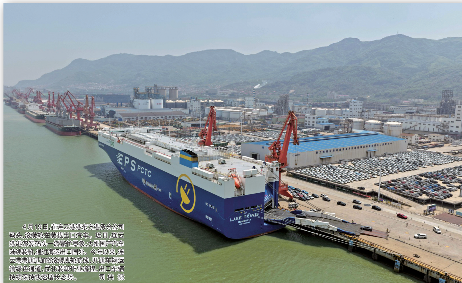
4月19日，在连云港港东方港务分公司码头，滚装轮在装货出口汽车。近日，连云港港滚装码头一派繁忙景象，大批国产汽车陆续装船，通过海运出口国外。今年以来，连云港港通过加密滚装班轮航线，开通车辆运输绿色通道，优化装卸作业流程，出口车辆持续保持快速增长态势。

南京加快推进“人工智能+软件”发展 本报讯 当前，人工智能正全方位重塑软件产业。2026年南京市加快推进“人工智能+软件”发展行动方案日前正式出台，以期驱动全行业生产方式变革、产业形态重塑、商业模式创新、发展能级跃升，打造“全国软件产业智能化第一城”。 方案提出明确目标：2026年，培育高水平行业领域人工智能服务商超100家、智能体开发商超100家，打造十大标杆智能工厂；培育自研软件智能开发测试工具超100款，全市重点软件企业智能开发工具应用普及率超90%；实施200个以上重点行业应用软件智能化改造项目，打造20个关键软件智能化升级标杆项目；培育300款行业智能体产品，打造50个以上高水平垂类模板。 为实现这一目标，方案提出实施智能化开发能力提升、软件产品智能化升级、智能体开发高地建设、软件企业智能化转型、智能化发展生态促进等五大行动，具体包括加快推进自研全流程智能开发工具，加速智能开发平台建设应用，建设人工智能OPC训练营促进开发者能力提升，组织开展智能化成熟度评估，加快行业应用软件智能化改造升级，制定人工智能安全软件产品培育清单，提升软件智能化安全水平，强化智能体技术攻关，繁荣智能体应用生态，围绕垂类大模型、智能体开发企业建立智能原生企业培育体系，建设软件智能化发展集聚区、“数字员工产业园”等。(付奇)