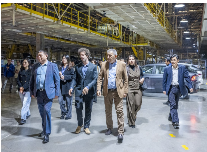
为深化南京与“一带一路”共建国家经贸往来，4月29日，“南京-阿根廷罗萨里奥经贸交流活动”在江北新区举办。图为代表团一行参观南汽集团。

南京市贸促会作为连接中外企业的桥梁纽带，始终致力于推动南京与全球各个国家和地区的经贸投资合作。座谈会中，南京市贸促会负责人系统梳理了近年来南京对拉美地区，尤其是与阿根廷的进出口贸易发展态势，全面推介南京市开放发展格局、产业布局优势以及江北新区开放创新高地、高度自贸罗萨里奥在深化中阿地方合作、促进双边友好