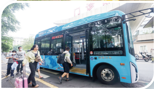
多地开通公交“微专线”畅通就医“最后一公里”