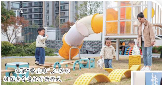
破解“带娃难”,江苏积极探索普惠托育新模式