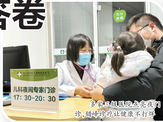
多家三级医院点亮夜间门诊,错峰诊疗让健康不打烊