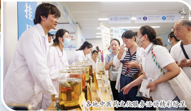
各地中医药文化服务活动精彩纷呈

改革纵深推进,“十四五”期间,江苏卫生健康事业加强“三医”联动,着力突破攻坚,加快构建优质高效的医疗卫生服务体系。聚焦群众看病就医中的急难愁盼,逐层级赋能,穿透式发力,促进医疗服务能力整体提升。江苏加快从“病有所医”向“病有良医”转变。