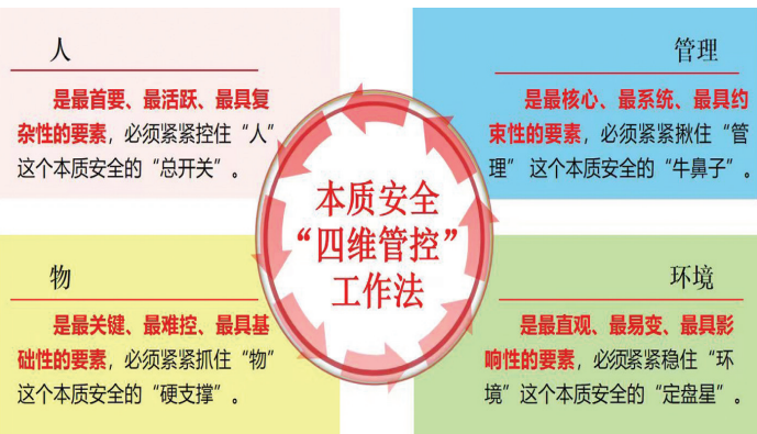
本质安全“四维管控”工作法概念图

习近平总书记高度重视安全生产工作,作出了一系列重要论述,深刻阐明了新时代抓好安全生产的核心理念、根本原则、科学方法与实践路径,为做好安全生产工