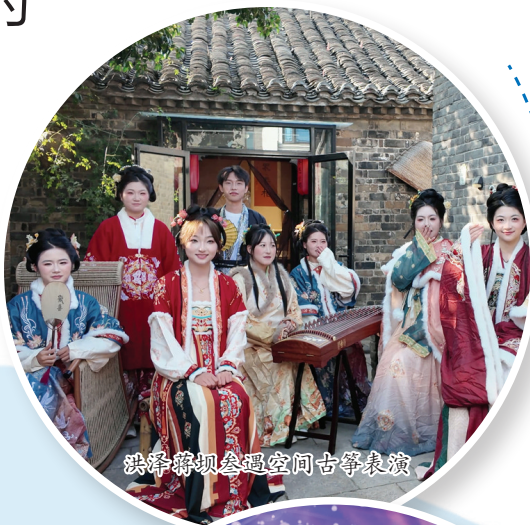
洪泽蒋坝会遇空间古筝表演

这个春节,不妨暂别都市喧嚣,奔赴老子山,赏百年石屋古韵,泡一池暖汤驱寒,品一锅吊炉火锅暖胃,于古村烟火袅袅间,邂逅独属于冬日的别样年味。