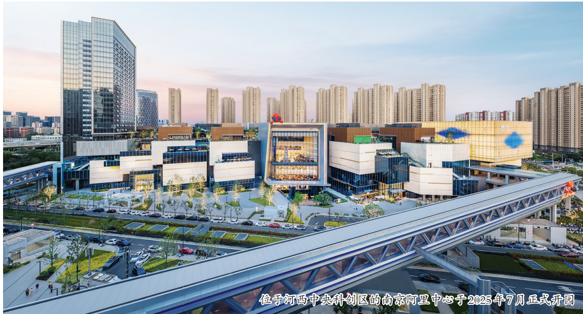
位于河西中央科创区的南京阿里中心于2025年7月正式开园