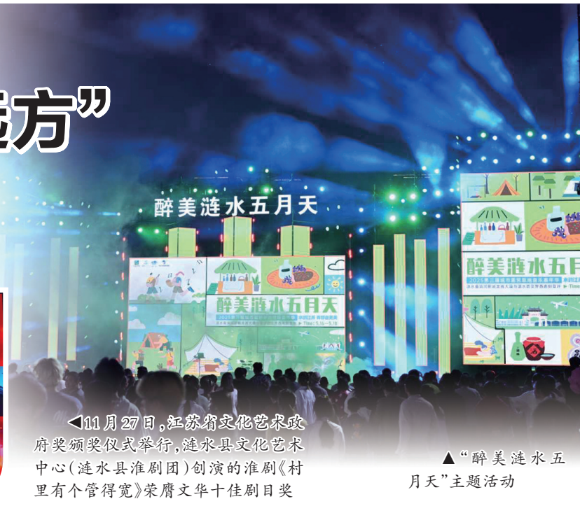
11月27日,江苏省文化艺术政府奖颁奖仪式举行,涟水县文化艺术中心(涟水县淮剧团)创演的淮剧《村里有个管得宽》荣膺文华十佳剧目奖