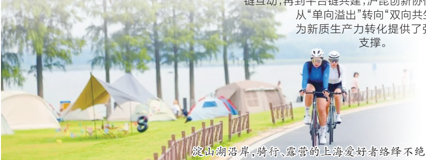
淀山湖沿岸,骑行、露营的上海爱好者络绎不绝

从交通互联到产业共兴,从民生共享到文化共鸣,昆山以先行先试的担当,让沪苏同城化不断迈向纵深。在长三角一体化发展的宏大叙事中,这座“县域最强”城市正与上海携手,以“一体化”思维破解发展难题,以“高质量”实践增进民生福祉,让江南文化在新时代绽放更璀璨的光芒,为区域协同发展提供着可复制、可推广的宝贵经验。