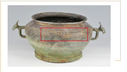
西周云雷纹双耳青铜甗