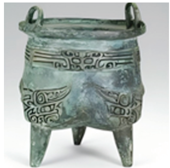
饕餮纹铜鼎 纹样:饕餮纹

据了解，此次大展集结了全国二十余家博物馆、超300件精品文物，涵盖一级文物、重要考古标本、青铜重器、典型纹饰玉器、唐代金银器、宋元瓷器与明清官窑等，阵容级别罕见。