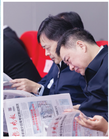
嘉宾们聚精会神翻看扬子晚报