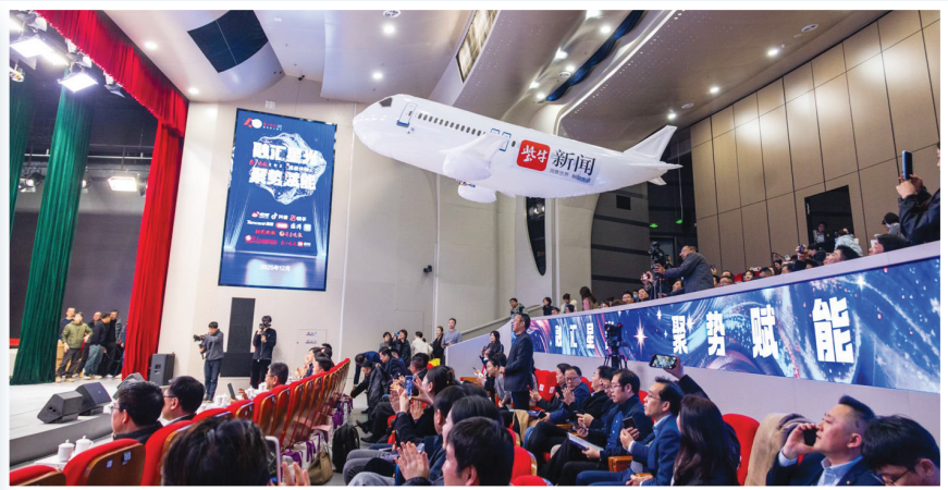
活动会场一架“飞机”起飞越高,象征着全域合作拥有更宽广天地