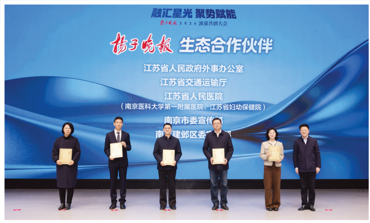
生态合作伙伴赠牌仪式