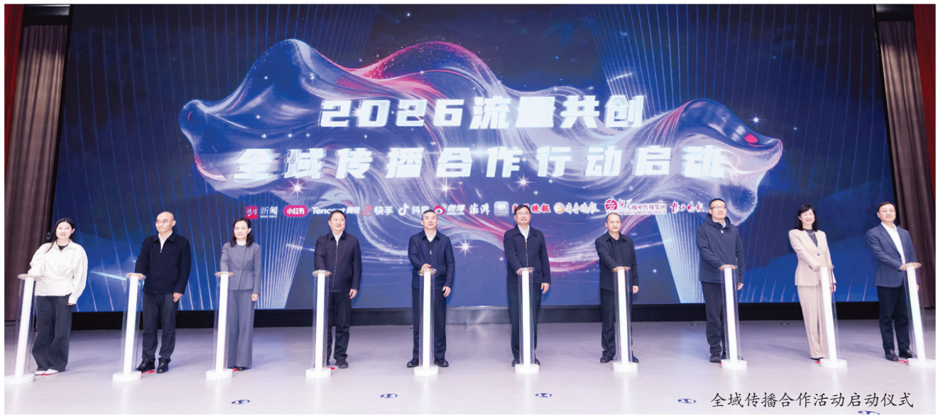
全域传播合作活动启动仪式