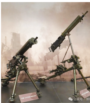
金陵兵工厂生产的马克沁重机枪