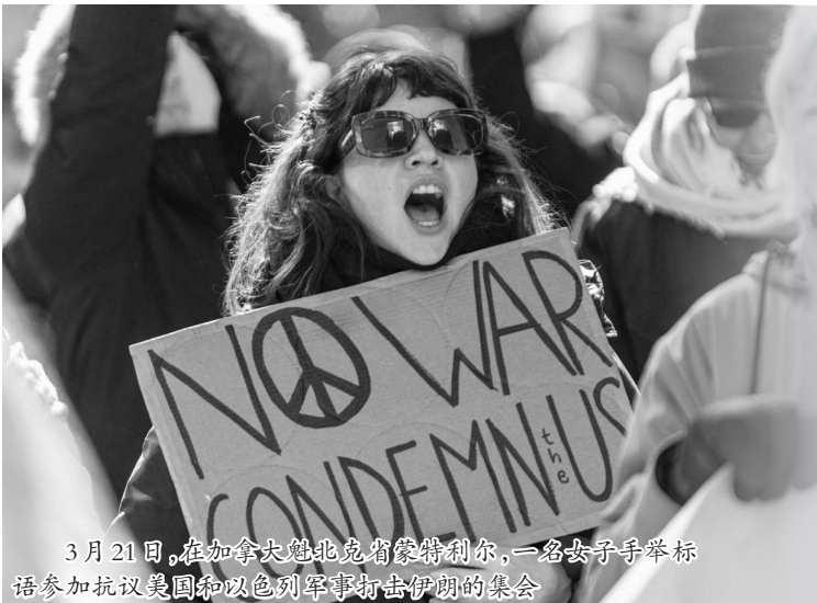
3月21日,在加拿大魁北克省蒙特利尔,一名女子手举标语参加抗议美国和以色列军事打击伊朗的集会