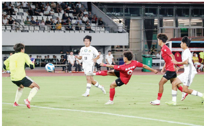
2025“省长杯”江苏省青少年校园足球联赛高中男子组决赛现场

从南京、苏州再到全省各地,江苏十三市校园足球的稳步深耕,共同撑起了“苏超”的青春底色。没有急功近利的拔苗助长,全靠完善的校园赛事体系、