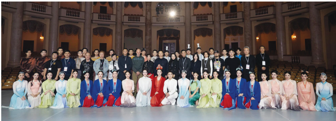
▲▼舞蹈诗《水墨江南》在俄罗斯索契冬季剧场精彩亮相

舞蹈诗《水墨江南》为俄罗斯带去了一封来自江苏水乡的情书,此次演出的相关负责人在接受俄罗斯当地媒体采访时说:“我们希望通过舞蹈这一世界共通的语言,让俄罗斯观众感受到江南文化的美,感受到中华文化的魅力。此次我们带着江苏文艺工作者的赤诚之心而来,希望让更多俄罗斯朋友通过江南这扇窗,看见一个真实、立体、全面的中国,以文化