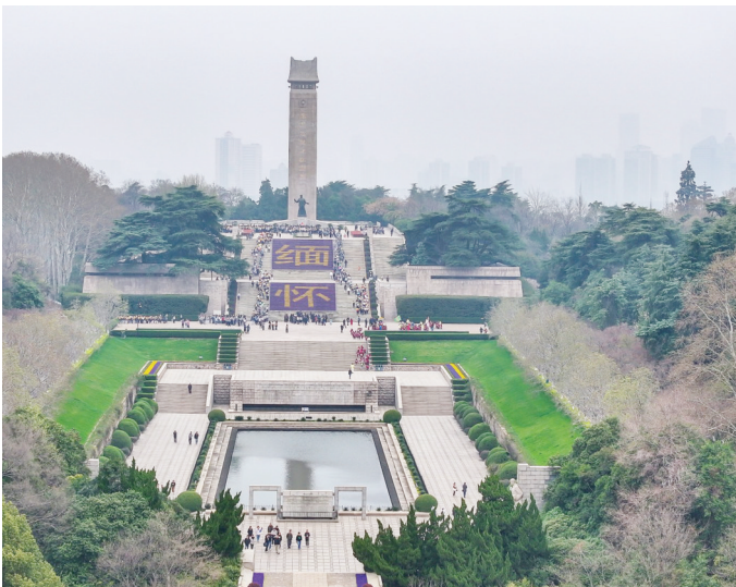
3月26日,南京雨花台烈士陵园“缅怀”与“致敬烈士 传承精神”大型主题花景亮相纪念碑广场。约9万盆花卉组成庄严花海,与陵园总计16万盆花卉共同构成春日里的深切追思。

南京近期天气:今天多云,偏东风3到4级,11℃到20℃左右;明天多云,东南风4到5级阵风6级,8℃到21℃;后天白天晴到多云,夜里多云转阴有小雨到中雨,偏东风3到4级,11℃到23℃左右