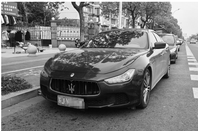
上图:当时花费85万元购买的玛莎拉蒂 右图:发动机号和登记记录不匹配