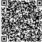
扫描二维码 观看视频