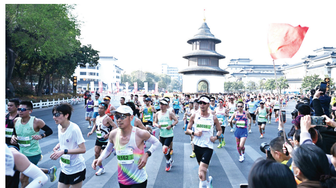
2026扬州半程马拉松现场

同一日,2026广西柳州马拉松圆满落幕,张水华以枪声成绩2小时36分23秒斩获全程马拉松女子组冠军。这是她继3月22日丽水马拉松夺冠后,时隔一周再度登顶。据悉,张水华在3月22日的丽水马拉松中,以2小时35分49秒打破赛会纪录夺冠,斩获4万元现金奖金(1万元冠军奖+3万元破