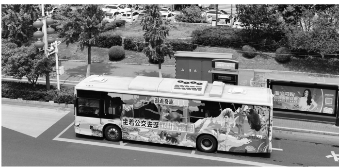
南京公交G28路

出多项便民措施。4月1日至4月3日,7至16周岁中小学生可凭学生证或身份证免费乘坐南京公交、有轨电车及轮渡。