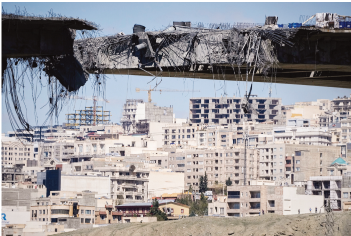
遭受受损的伊朗卡拉季市贝伊克公路桥

继美国和以色列两次袭击伊朗卡拉季市贝伊克公路桥后,伊朗媒体2日列出伊方可能在中东地区实施反击的目标。