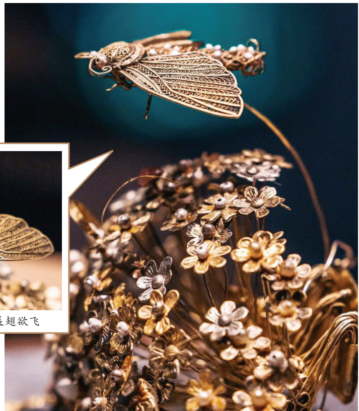
闹蛾金钗亮相国博

的密码。“闹蛾”之名，源于“蛾儿戏火”——正月十五元宵夜，灯火璀璨，飞蛾会扑灯，古人以此应景，寓意热热闹闹、团团圆圆。宋代辛弃疾的词中“蛾儿雪柳黄金缕，笑语盈盈暗香去”描绘的正是少女们头戴“闹蛾”、出游赏灯的热闹场景。飞蛾产卵非常多，蛾有“多子”的寓意，而李静训墓出土的这件金钗是目前中国考古发掘出土的最早的闹蛾实物。在中国国家博物馆