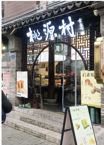
位于南京老门东的“桃源村”