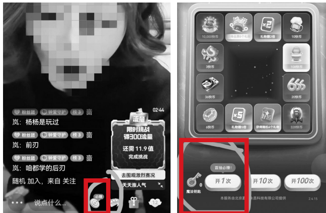
直播间和游戏内出现的“必赚”宣传元素