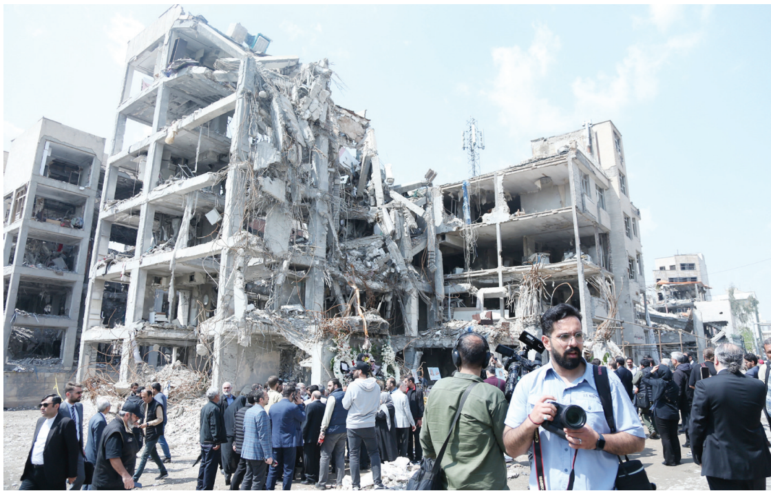
4月20日,在伊朗首都德黑兰,驻伊朗使节和外国媒体查看一处在美以袭击中被损毁的居民区建筑