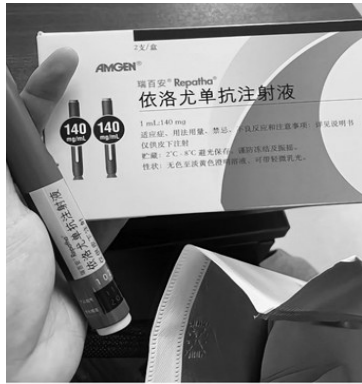
血脂哗一下就降到正常了! 生完娃后几年血脂一直偏...