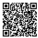
南外“金牌教练团” 南外特长生采访