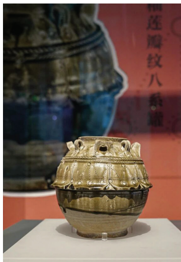
盐城青釉莲瓣纹八系罐

在中国陶瓷史上,晚唐的秘色瓷是绕不开的神秘高峰。在南通博物苑的镇馆之宝里,就有一件本地出土的晚唐五代时期越窑青瓷皮囊壶,该瓷器的器型是北方游牧民族使用的皮制水囊。南国水乡,为何要烧一只塞外马背上的壶?《资治通鉴》记载:“长兴二年,吴越王钱元瓘遣使北上,以越窑秘色瓷易契丹良马三百匹。”五代十国乱世里,吴越国把越窑青瓷当硬通货。这只皮囊壶,正是当年“外贸定制款”的活证据。