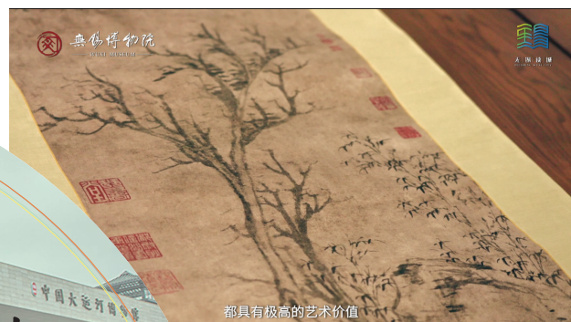
都具有极高的艺术价值

连云港东海水晶博物馆的“晶王”,重达1.99吨,这块水晶表面覆盖着密集的小晶簇,内部云雾状包裹体中天然形成“鲤鱼跃龙门”的奇观。虽非传统意义上的文物,却是大自然馈赠江苏的“镇馆之宝”。通体晶莹,浑然天成。站在它面前,天地造化之巧令人屏息。