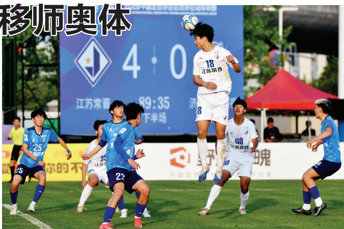
4月24日,江苏常晋队5比0战胜济南林凯赛福队,小组排名第一晋级大区排位赛

2026中冠联赛规模再创历史新高,全国共计80支球队、2283名球员参赛,各支队伍激烈角逐稀缺的升级中乙联赛的名额,赛事整体竞技水准、对抗强度与关注度持续走高。