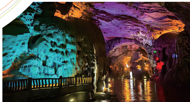
宜兴善卷洞