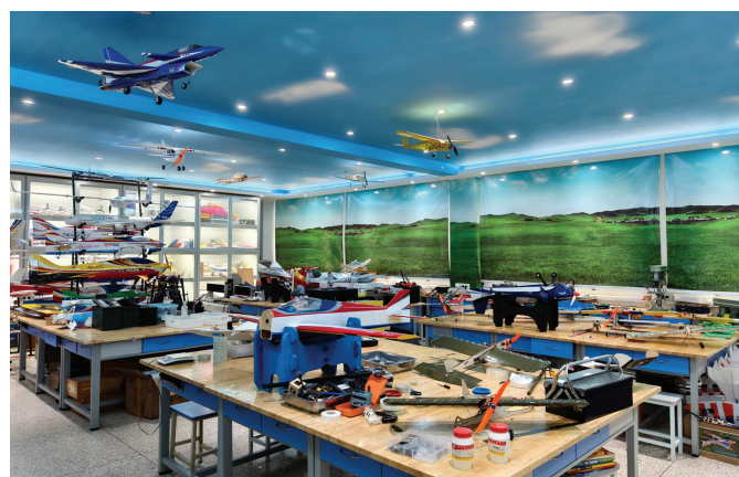
南京田家炳高级中学航模馆