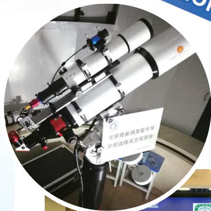
智能远程天文观测台

南京田家炳高级中学以“炼成大器、蔚为国宝”为校训,塑造“给奋斗定义,建构青春坐标”的学生成长形象。校园依山傍水、绿树成荫,书香浓郁、氛围雅致,是兼具人文温度与创新活力的大爱田园、创意学园、活力家园、文化圣园。学校热忱欢迎广大优秀学子加入,在这里筑梦、追梦、圆梦,共赴星辰大海。