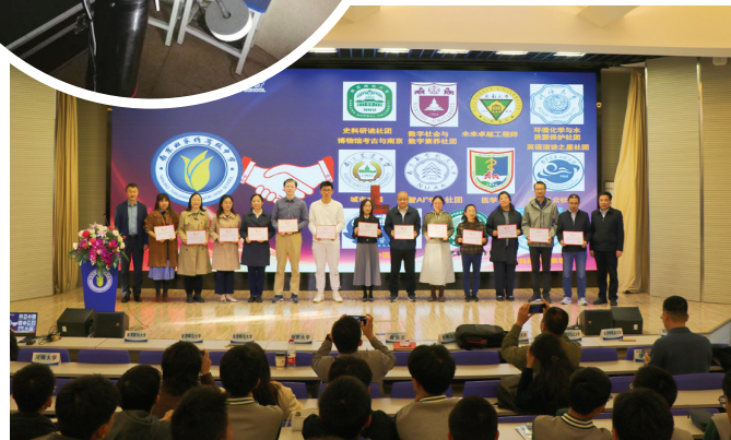
南京田家炳高级中学“双高社团”启动