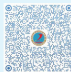
特长生报名登记(微信扫码)