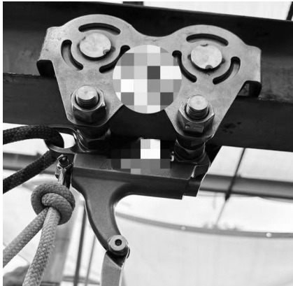
新型的高空秋千释放器