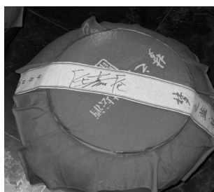
线上平台申请调度,按需取酒,景区会安排专人配送。

关于网传价格,工作人员回应称,“这坛酒应该有200斤,当时售价大约是每斤3000元,所以总价达到60万元。”此外,洋河酒厂旅游区的封坛酒服务面向所有消费者,50斤起购。游客购买后,可选择存放在景区或自行带走,也可通过